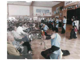
施設でのボランティア活動も活発です。