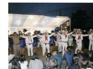
江陵祭では衣装も審査対象になります。