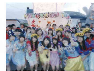
江陵祭メインの行灯パレード。