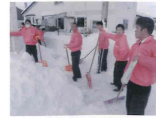
老人宅の除雪ボランティア。