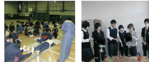
普通救急救命講習。職業体験学習も大切な授業の一環です。