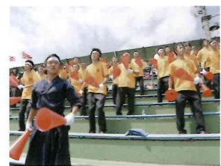
野球部・夏の大会1回戦は全校応援。