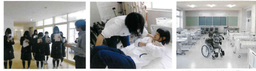
町内の福祉施設で見学実習。介護現場を学びます。 介護実習では大切な経験をたくさんします。 介護用ベッドや車椅子を備えた介護実習室。