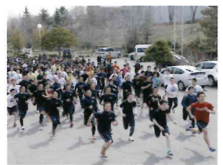
春には校内マラソン大会が行われます。