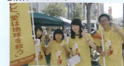
募金活動や地域貢献にも積極的に参加。

交通安全の呼びかけや募金活動など、地域・社会貢献を目的とした社会奉仕活動には全校を挙げて取り組んでいます。この体験を通じて、生徒一人ひとりが社会との密接な関わりを学んでいます。平成17年9月、本校のボランティア活動が認められ、国際ソブチミスト協会よりSクラブの認証を受けました。また、平成19年には幕別町より善行賞をいただきました。そして平成21年には福祉科、平成24年には書道部、平成25年には野球部(地域ゴミ拾い活動)が善行賞をいただきました。