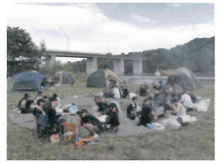
3年に一度の全校キャンプ。