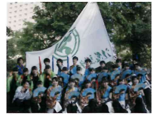
札幌よさこいソーラン祭りに連続の出場です。