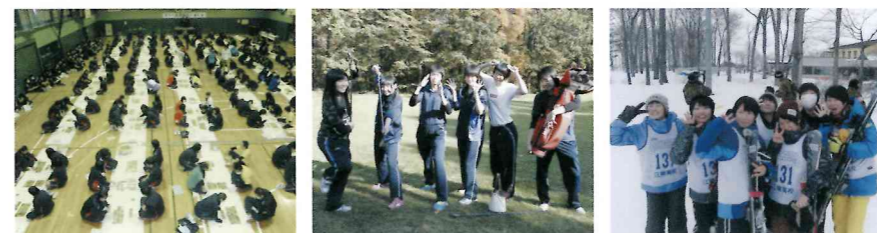
全校百人一首大会の様子。体育ではパークゴルフやゴルフも導入。スキー、スノーボード実習。