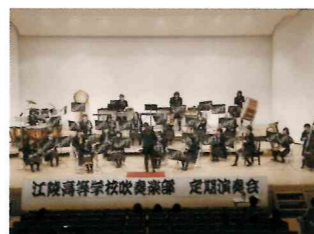
【吹奏楽部】ついに金賞受賞しました!次は全道での活躍です。