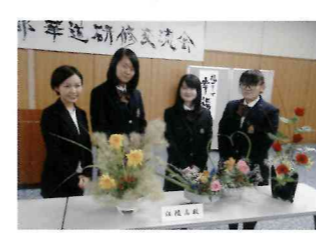
【華道部】品評会への出展など積極的に活発な活動を続けています。