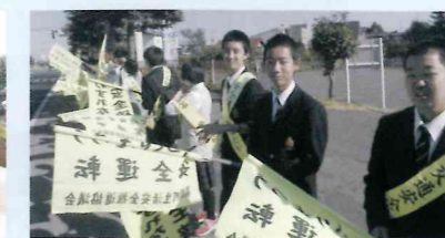
地域住民に交通安全を呼びかける。