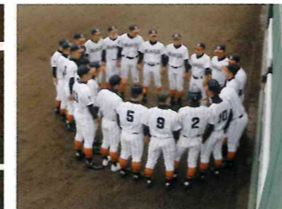
【野球部】ついに北海道大会進出!甲子園まであと1歩。