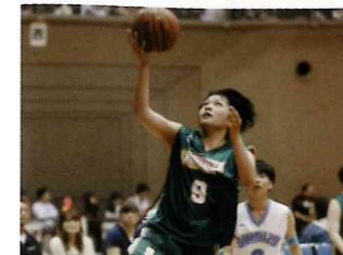
【バスケットボール部】毎年力を付けて来ています。シード権確保!頑張っています。