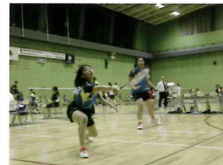
【バドミントン部】全国選抜大会に初出場を果たしました。次はインターハイです。