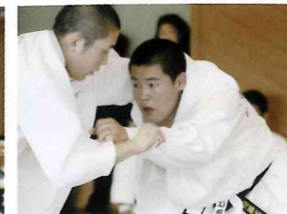
【柔道部】全道大会の常連。心技体での向上を目指しています。