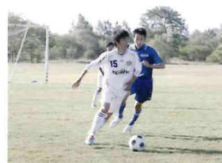
【サッカー部】新生サッカー部徐々に力を付けてきています。御期待下さい。

全校生徒の8割以上が、学校生活の一部としてクラブ活動に参加しています。クラブ活動は自分の持っている力を発揮し、精神力を養う場でもあり、人格形成にも大きな役割を果たしています。将来性のある数多くの有望な生徒が集まり、スポーツ系、文化系クラブとも生徒一人ひとりの個性を活かし、活発な活動を続けています。