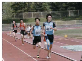
【陸上競技部】インターハイ出場者が多数輩出。年々実力が付いています。