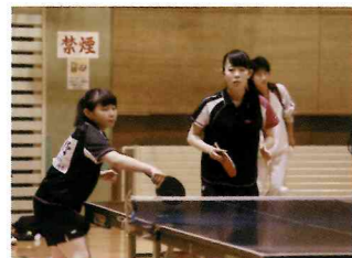
【卓球部】全道大会の常連となりました。練習環境も充実して更に期待できます。