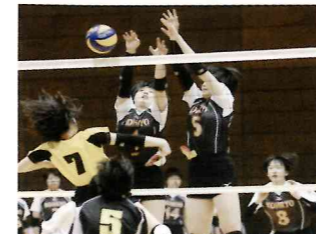
【バレーボール部】全道上位に躍進してきました。全国出場が大いに期待出来ます。