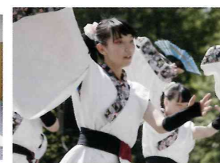
【福祉クラブ】募金活動や施設訪問、よさこいなど幅広い活動をしています。