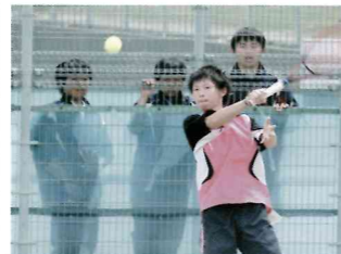
【テニス部】学校専用コートで、ますます充実し活発化しています。