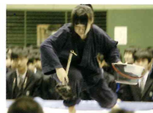
【書道部】全国大会出場の常連です。実力もトップクラスです。